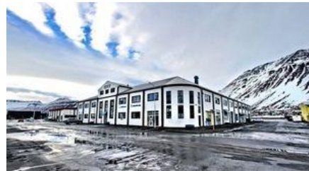
Höfuðstöðvar Atvest á Ísafirði

Atvest er með þrjár starfsstöðvar á Vestfjörðum. Í Árnagötu 2-4 á Ísafirði, í Aðalstræti 53 á Patreksfirði og í Höfðagötu 3, Hólmanvík. Aðalskrifstofur þess eru á annarri hæð að Árnagötu 2-4 Ísafirði þar sem félagið er í samfélagi með fyrirtækjum og stofnunum. Opnunartími er almennur skrifstofutími en með undantekningum samkvæmt samkomulagi. Skrifstofan hefur lokað vegna sumarleyfa tvær vikur fyrir verslunarmannahelgi.