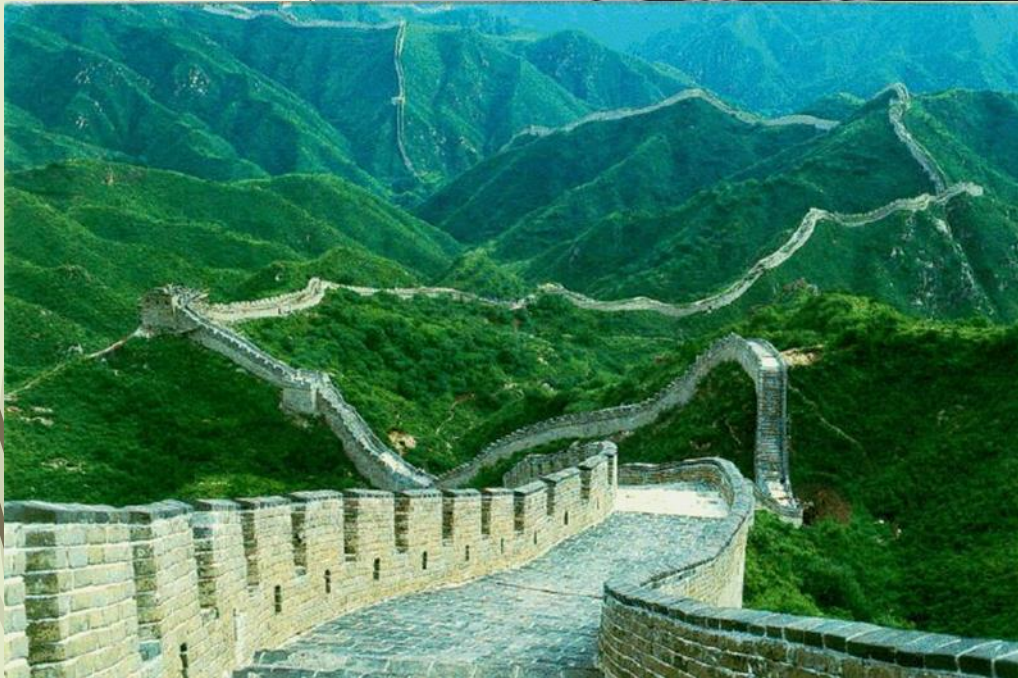
Glæra frá Þóroddi Bjarnasyni HA