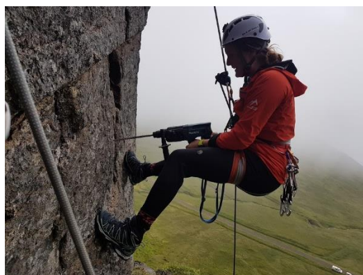
Klettlífur í Norðurfirði

Verkefnið Fræðasetur í Finnbogastaðaskóla komst ekki til framkvæmda og var endurúthlutað sem því nam. Verkefnið Smávirgjun í Ófeigsfirði frestast til sumarsins 2024 en öðrum verkefnum er lokið og styrkveitingar að fullu greiddar.