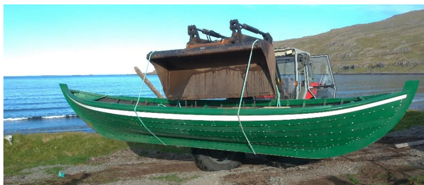
Báturinn Mjóni í Ófeigsfirði

Verkefni Reyking á þorski og ýsu, Nytjaplöntur í Árneshreppi, Það er heim og Strandaband komust ekki til framkvæmda og var endurúthlutað sem því nam. Smávirðjun í Húsá og Deiliskipulag fyrir heilsárshús koma til framkvæmda sumarið 2024 en öðrum verkefnum er lokið og styrkveitingar að fullu greiddar.