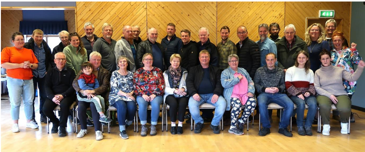
Frá íbúafundi 2023

Svo sem sjá má á undirmerkmíðunum er lykilatriði að fá fram skoðanir íbúana sjálfra á framtíðarmöguleikum heimabyggðarinnar og leita lausna á þeirra forsendum í samvinnu við ríkisvaldið, landshlutasamtök, atvinnuþróunarfélög, sveitarfélagið, brottflutta íbúa og aðra hagaðila.