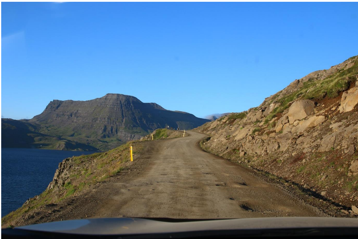
Aðkallandi er að leggja nýjan veg yfir Veiðileysuháls

Tilraunaverkefni með snjómokstur verður haldið áfram og verður mokað tvisvar í viku yfir Veiðileysuháls og Kjörvogshlíð þegar aðstæður leyfa. Vonir standa til þess að þetta fyrirkomulag sé komið til að vera en það hefur þó ekki fengist staðfest.