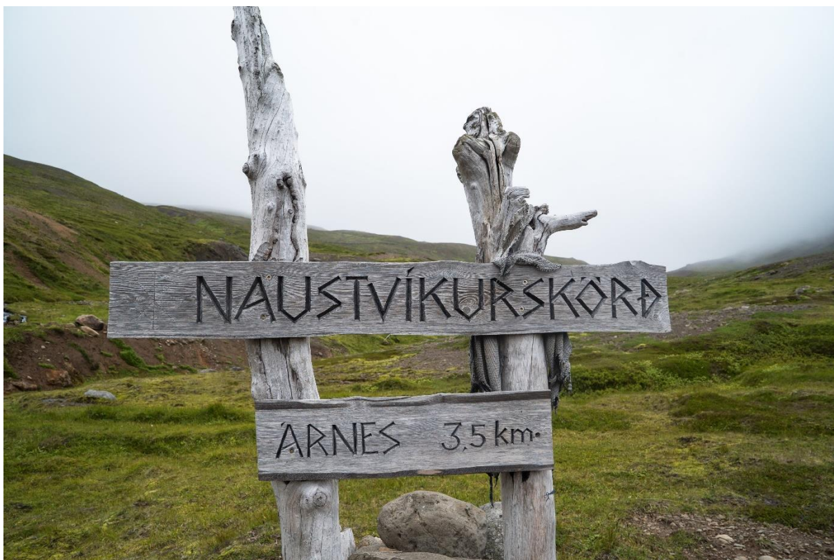
Hér þyrfti að koma heilsársvegur yfir skörðin.