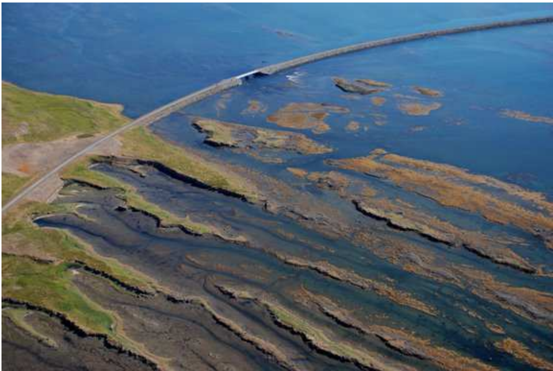
Króksfjarðarnes og Gilsfjörður