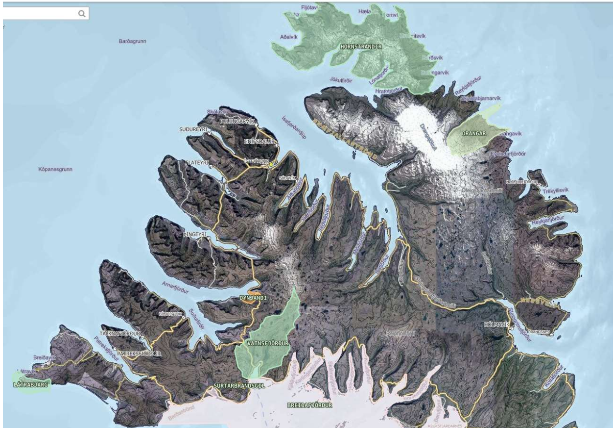
Mynd 1. helstu friðlýst svæði á Vestfjörðum, á kortinu sjást ekki friðlöndin í Flatey eða Hrísey í Breiðafirði