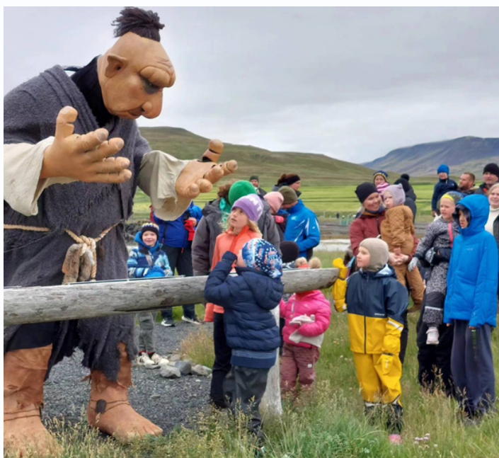
Tufti tröll hittir börnin á Náttúrubarnahátíðinni