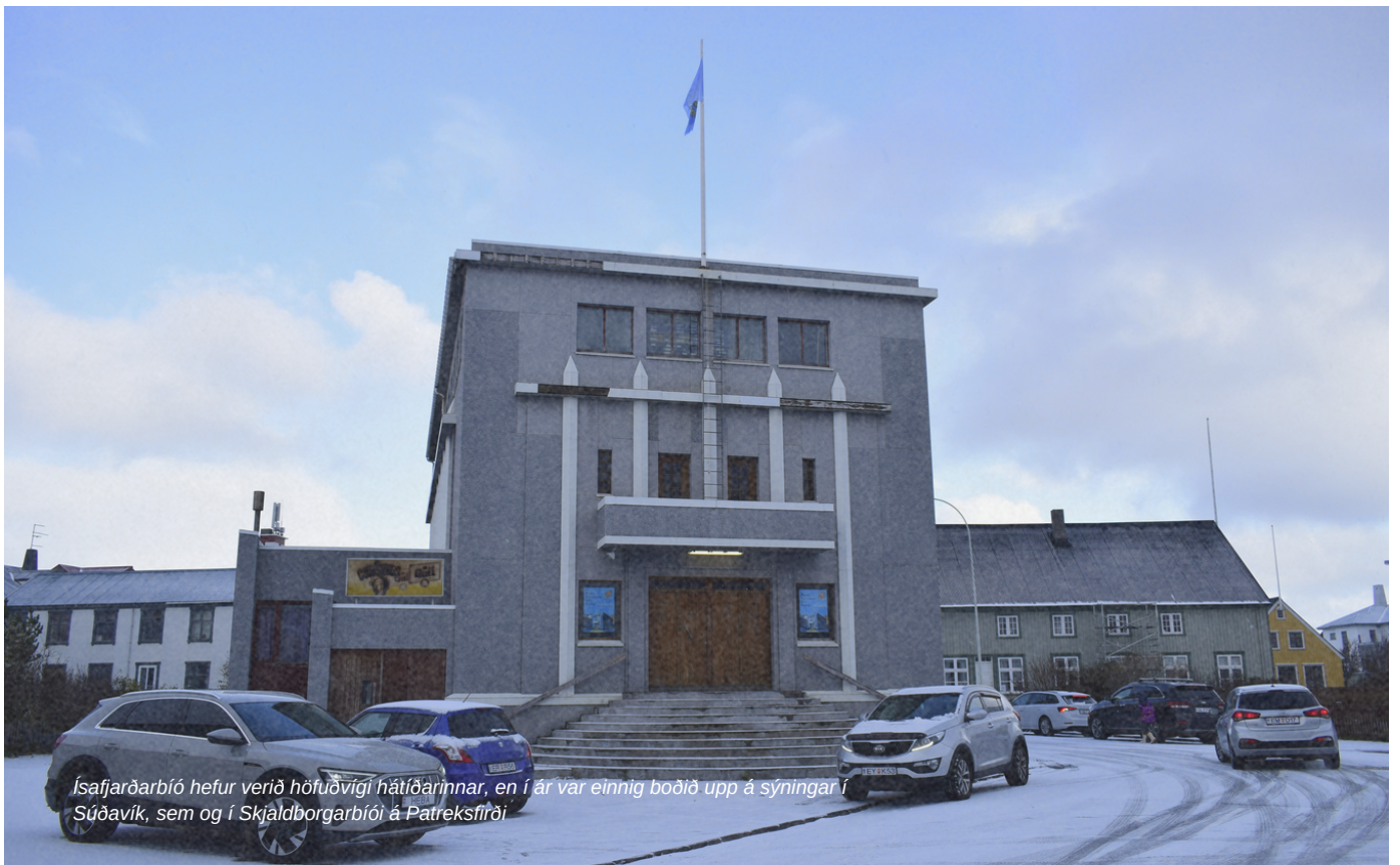
Isafjarðarbíó hefur verið höfuðvigi hátíðarinnar, en í ár var einnig boðið upp á sýningar í Súðavík, sem og í Skjaldborgarbíó á Patreksfirði