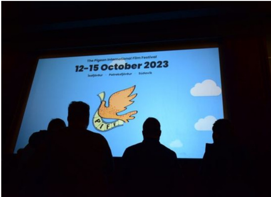
Frá opunarhátíð PIFF í Ísafjarðarbiói