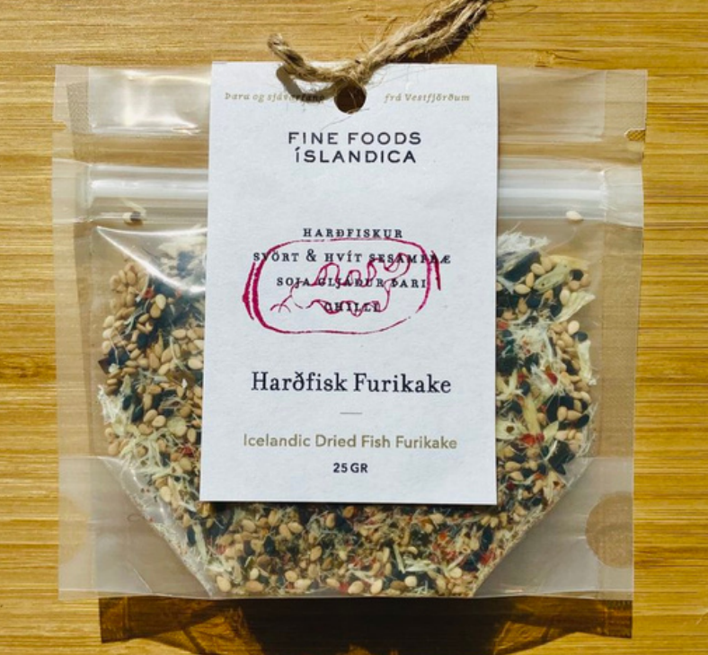
Ein af vörum Fine Foods Íslandica, Harðfisk Furikake