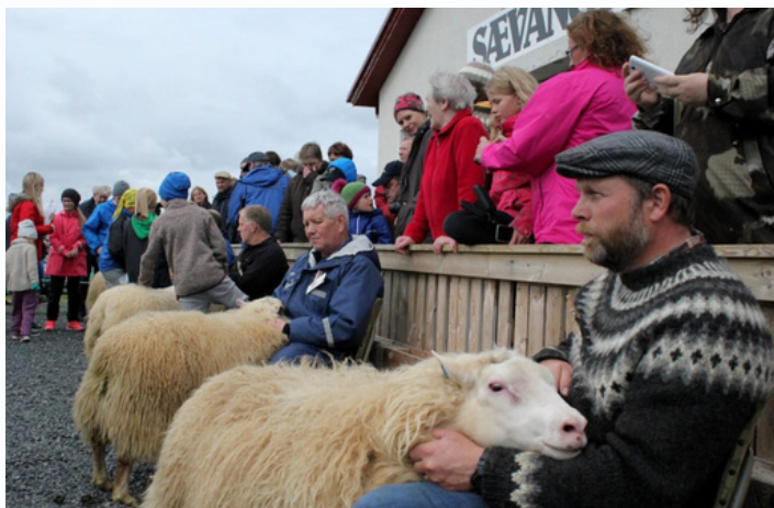
Íslandsmótið í hrútaðómum er einn af helstu viðburðum Sauðfjársetursins