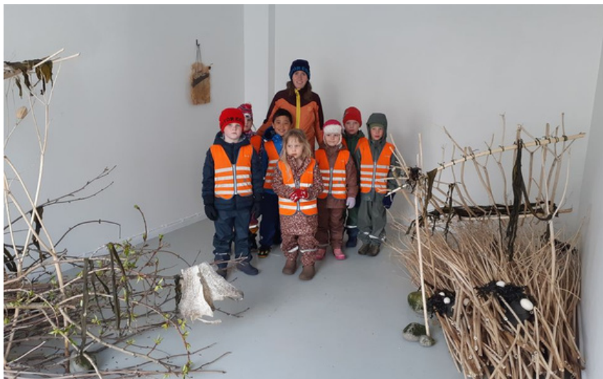
Leikskólabörn heimsækja Gallerí Úthverfu