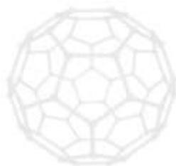
CARBON – KÖLVETNI Vísindi listanna / listin í vísindunum